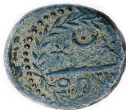
Fig. 6: Fotografía del R/ de la segunda moneda de Ocuri encontrada en 2013 (Colección particular).

En el A/ presenta cabeza varonil posiblemente barbada mirando a derecha y con diadema enmarcada por grafila de puntos y radios de un bonete. El R/ presenta grafila de puntos desplazada