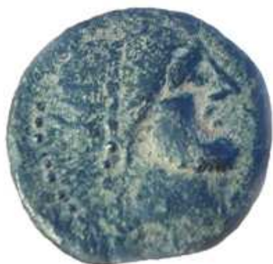
Fig. 5: Fotografía del A/ de la segunda moneda de Ocuri encontrada en 2013 (Colección particular).

La moneda (cf. figs. 5 y 6) se describe como un semis más que un cuadrante, ya que su peso es de 3,28 gramos (demasiado para un cuadrante y algo escaso para un semis) y un módulo de 17 mm. El publicado por Villaronga pesaba 3,80 y tenía un diámetro de 16 mm, muy similares por tanto. Ambas están descentradas, pero si se comparan parecen provenir del mismo cuño, con casi idénticas imperfecciones, más apreciables en la segunda moneda al no ser un dibujo o foto. Conserva una pátina excelente y está en buen estado (BC).