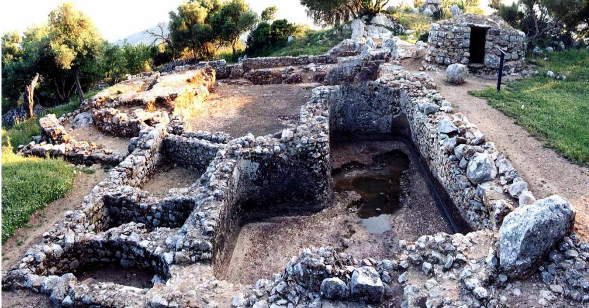
Fig.2: Fotografía de las termas de la ciudad romana de Ocuri , las únicas descubiertas hasta ahora en la sierra gaditana.

En la actualidad, se puede visitar de la ciudad, aparte de su ya nombrado Mausoleo, su imponente muralla ciclópea, de origen ibérico, varias de sus viviendas con grandes aljibes y cisternas, el foro y unas impresionantes termas (cf. fig. 2), las únicas hasta ahora encontradas en la Sierra de Cádiz. Para aquellos interesados en la ciudad romana y el yacimiento en sí, recomiendo los artículos que sobre ella enumeramos en la bibliografía al final de este artículo.