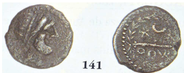
Fig. 9: Fotografía de la tercera moneda de Ocuri subastada por Vico en 2009 (copia de la fotografía del catálogo nº 119 de Jesus Vico S.A.).

En consecuencia, adquirí el catálogo 119 de Subastas Vico (a los que agradezco la amabilidad con la que me han tratado) y pude comprobar cómo efectivamente se puso a la venta un ejemplar con el número de Lote 141, dentro de las adscritas a Iptuci , con la tipología igual a las dos analizadas anteriormente y con la siguiente descripción: « Cuadrante. A/ Cabeza diademada y barbada a derecha. R/ Dentro de corona: estrella, creciente sobre cetro, debajo leyenda : OQVR. AE. 3,6 gramos. I-no. VIL-125/5. MBC. Muy rara » (cf. fig. 9).