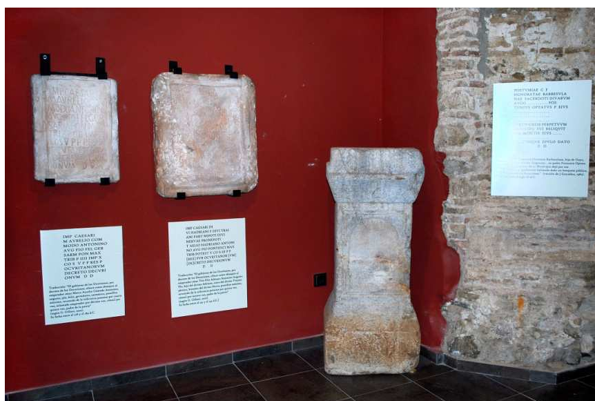
Fig. 1: Copias de las dos inscripciones halladas hasta el momento en el yacimiento de Ocuri con referencias a la “ Respublica Ocuritanorum ” y pedestal de una sacerdotisa augustal, expuestas en el Centro de Interpretación de la Historia de Ubrique.

hallazgos para dar “cuenta a la Nación”, como dice en su diario 1 . De hecho, Vegazo dejó constancia escrita y detallada de sus numerosos descubrimientos en un auténtico “Diario de excavaciones”, donde relató pormenorizadamente las áreas que fue excavando, los sectores del yacimiento, se interesó por la funcionalidad de las estructuras exhumadas, trató de reconocer los distintos momentos de ocupación del yacimiento, anotó las piezas recuperadas, describió los fragmentos escultóricos con todo detalle e incluso plasmó anotaciones sobre las coloraciones y los tipos de tierra que se extraían, en algo que podríamos considerar como un esbozo de rudimentaria estratigrafía, por lo que este manuscrito sería un documento de primera índole para la historia de la arqueología andaluza. De aquí, que lo hayamos considerado como un auténtico “pionero” de la arqueología de campo, muy diferente de los eruditos ilustrados que dominaban la Real Academia de la Historia en aquella época 2 .